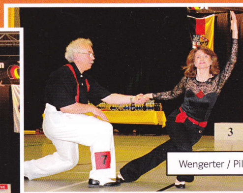
Wengerter / Pilawa