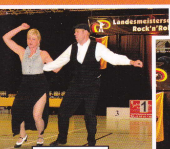
Bellino / Rust