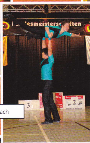
Kirz / Quach